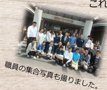
職員の集合写真も撮りました。