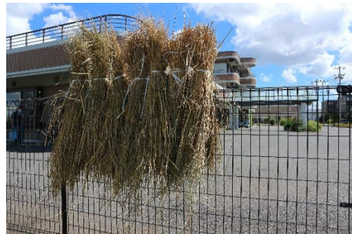
特別養護老人ホーム 稲毛こひつじ園