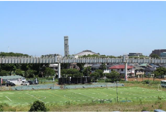
運営：特定非営利活動法人コラソン千葉スポーツクラブ 事務局：千葉市稲毛区園生町1015-35 ☎ 043-256-2820 ☎ 043-332-9822