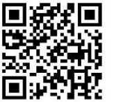
特別養護老人ホーム 稲毛こひつじ園