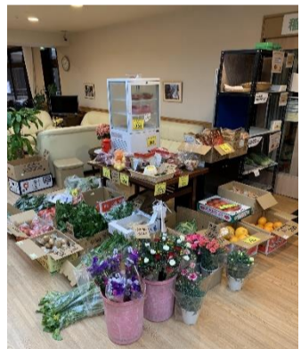
こひつじ市場 入荷状況 ☎043-207-5599

現在、こひつじ市場の開催を中止しておりますが、農家さんから地域の皆様のためになればと、新鮮な野菜・お花がロビーに届いております。お近くの方は、是非立ち寄ってみてください。