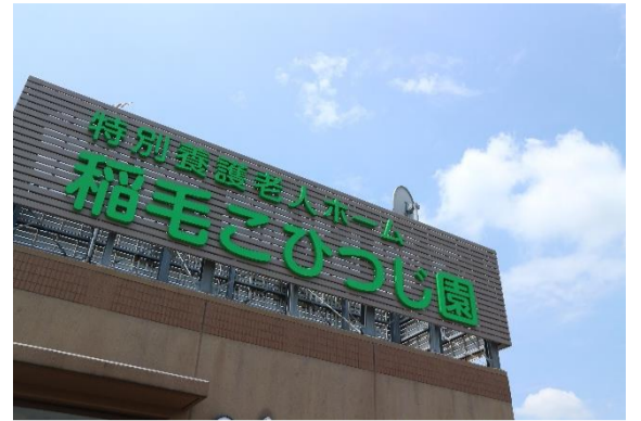
特別養護老人ホーム 稲毛こひつじ園